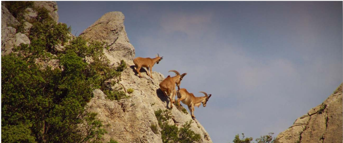
Arruís en sierra de Aitana